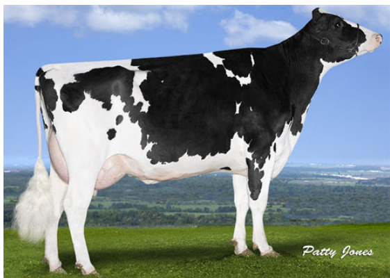
PROGENESIS ENFORCER PAT FIFTH DAM